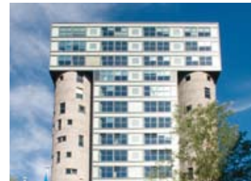
Logistik und Vertrieb