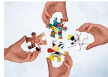
Chemicals & Solutions